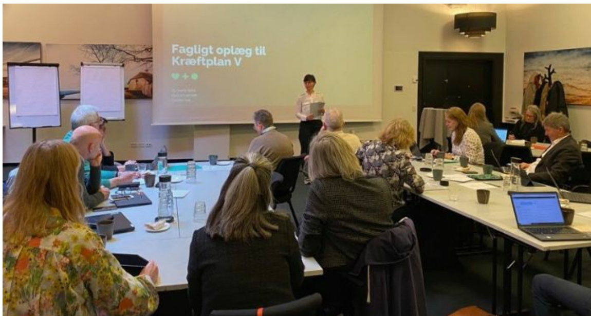
Fagligt udvalg er DCCC's 'motor', og medlemmerne er udpeget på baggrund af deres indsigt i kræftområdet nationalt såvel som internationalt.

DCCC's faglige udvalg var af Sundhedsstyrelsen inviteret til at rådgive om den kommende Kræftplan V. Her lød budskabet, at der er brug for langsigtede løsninger og fortsat udvikling af hele patientforløbet. Derfor er det afgørende, at vi øger det nationale og tværsektorielle samarbejde og tænker i strukturer, der understøtter ét samlet kræftforløb. Læs mere nedenfor, hvor vi også vil løfte sløret for en kommende temadag om AI.